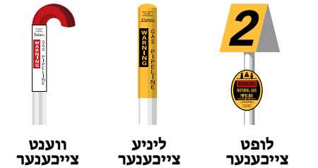
צייכענערס אויסזען קען זיין אנדערש אין אייער געגנט.

ענברידזש האט פארגעשריטענע זיכערהייט מאסנאמען פאר פיפליינס וואס גייען אריבער שטרעקעס פון וואסער און שטארק באוואוינטע אדער ענווייראמענטל-עמפונדליכע געגנטער. צו ליינען מער וועגן אונזער פיפליין פארזיכערונג באמיאונגען, באזוכט enbridge.com/safety .